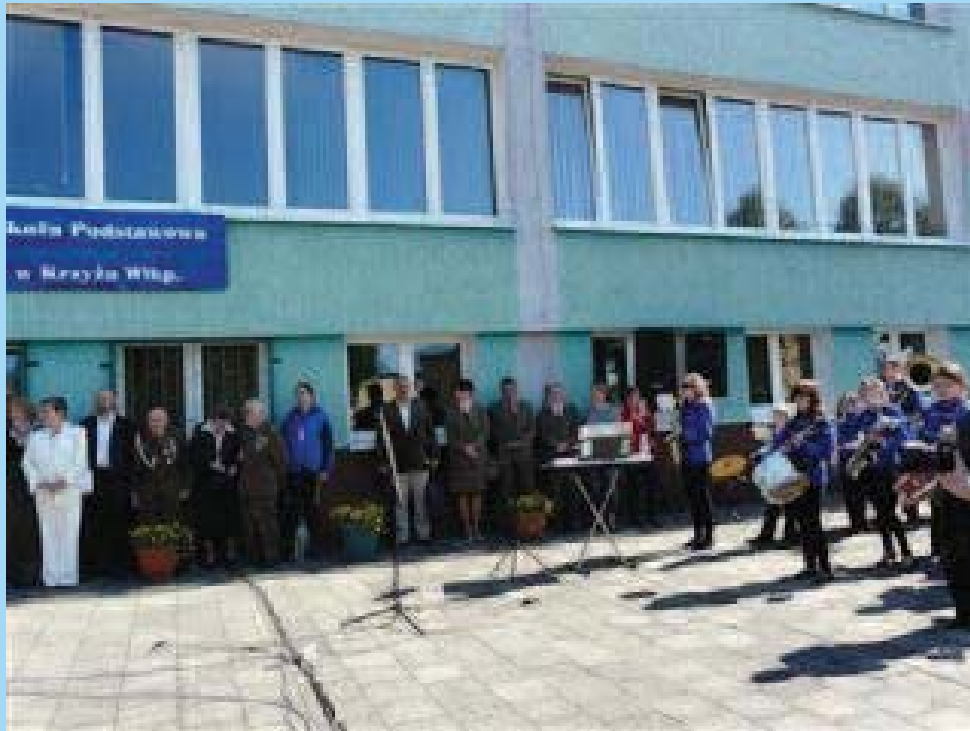
Vor dem Hauptgebäude - links die Gäste, rechts das Stadtorchester