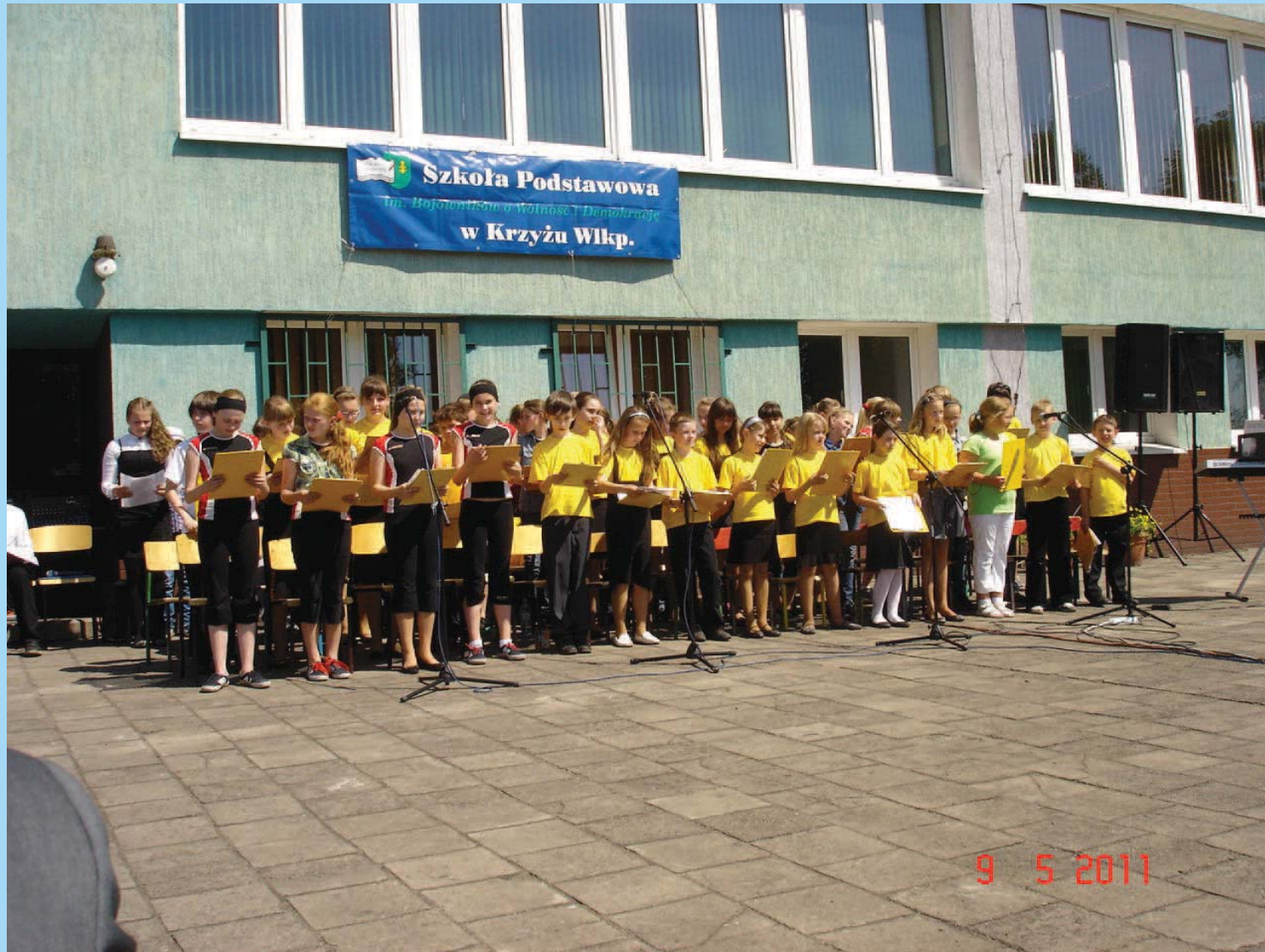
Schulchor anlässlich des Schulfestes