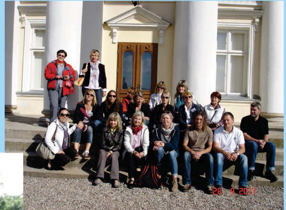
Besuch des Museums „Narodowe“

Mitglieder des Ausschusses fahren zur Weiterbildung in das LISUM Berlin/Brandenburg