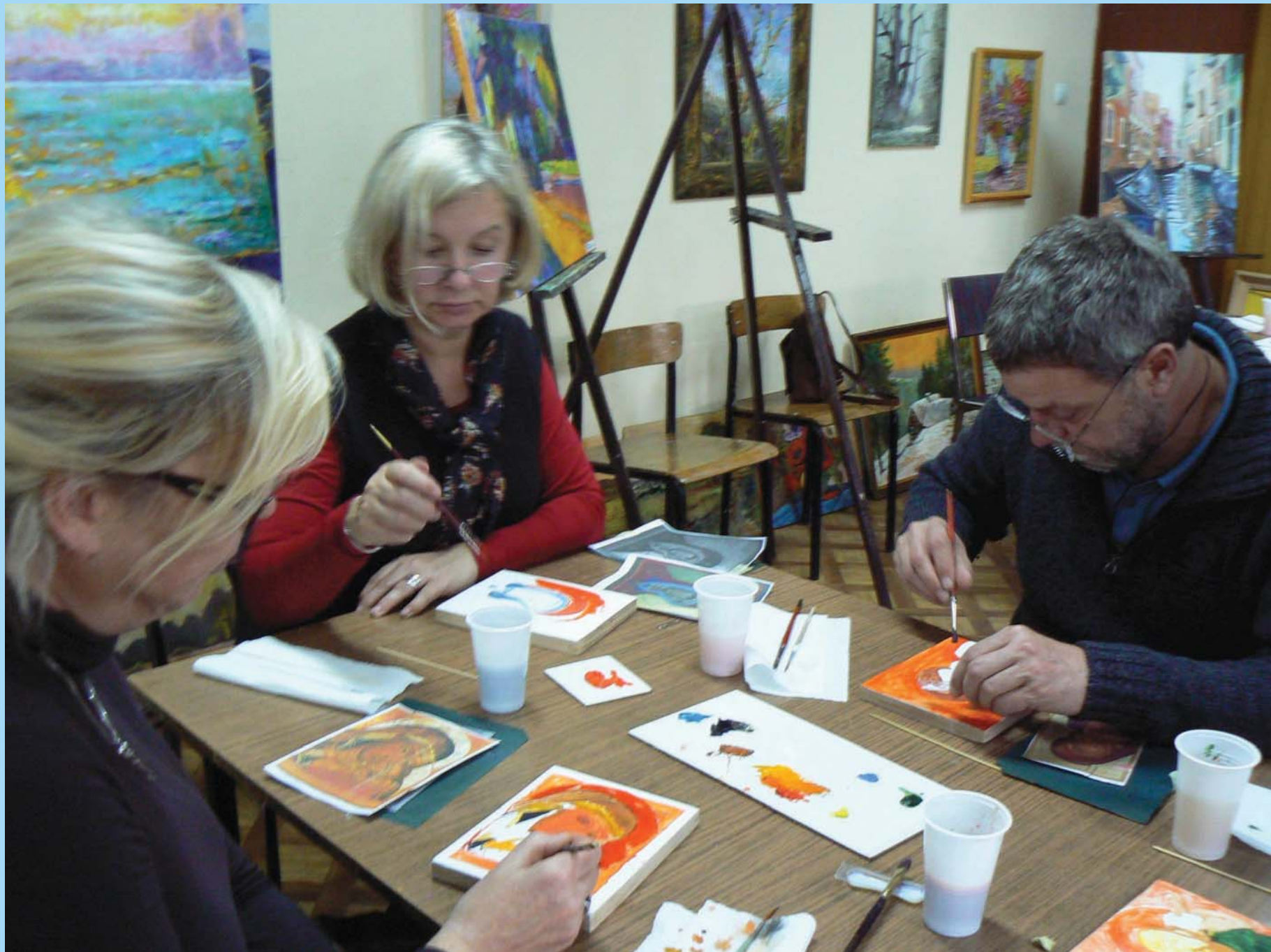
Entspannung durch Ikonenmalerei