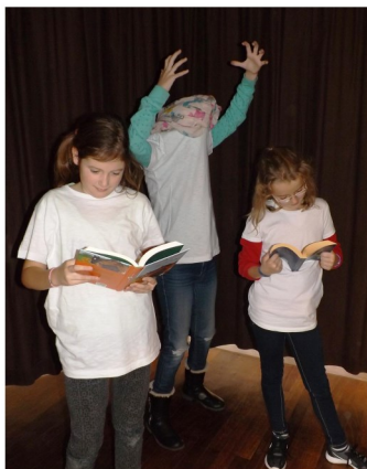
Die LeseProfis der Matthias-Claudius-Grundschule

LeseProfis Sonderausstellung zur Bildung, Jugend und Weiterbildung berlin