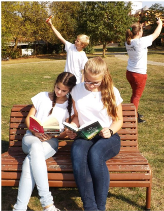
Die LeseProfis des Schiller-Gymnasiums

LeseProfis Peerprojekt zur Leseförderung Sonderausstellung zur Bildung, Jugend und Weiterbildung berlin