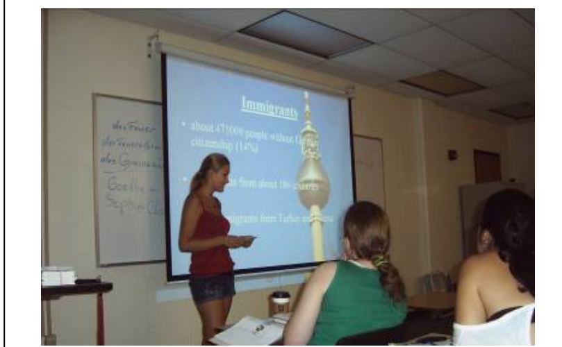
Schülerin des Goethe-Gymnasiums bei einer Präsentation an der Western Kentucky University