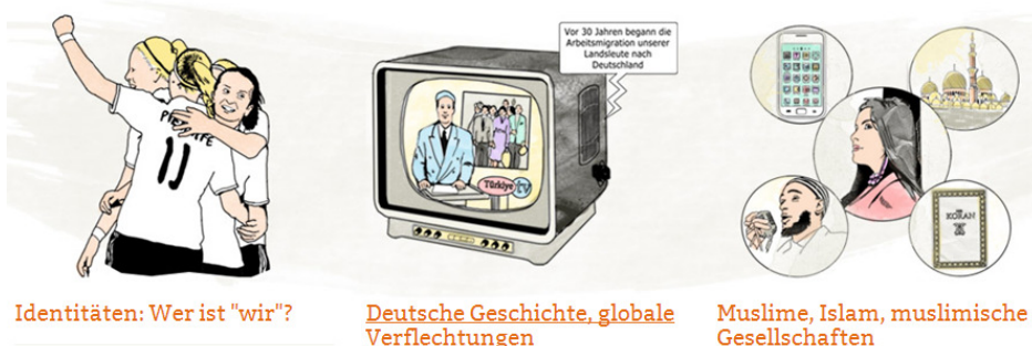
Identitäten: Wer ist "wir"?