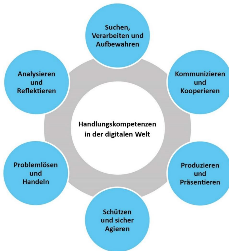
Abbildung 2: Handlungskompetenzen in der digitalen Welt

Die beruflichen Schulen knüpfen in ihren Bildungsprozessen an das Alltagswissen der Schülerinnen und Schüler und an die Kompetenzen an, die sie an allgemeinbildenden Schulen im Umgang mit digitalen Medien erworben haben. Es ist eine Querschnittsaufgabe des fachlichen und überfachlichen Lernens in der beruflichen Bildung, dass diese Handlungskompetenzen in der digitalen Welt erworben und weiterentwickelt werden. Maßgebend ist hierbei der Kompetenzrahmen der Strategie der Kultusministerkonferenz (KMK) zur Bildung in der digitalen Welt, der insgesamt sechs digital konnotierte Kompetenzbereiche für alle Schulformen beschreibt (vgl. Abbildung 2): 9