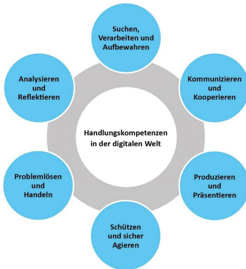
Abbildung 2: Handlungskompetenzen in der digitalen Welt

Die beruflichen Schulen knüpfen in ihren Bildungsprozessen an das Alltagswissen der Schülerinnen und Schüler und an die Kompetenzen an, die sie an allgemeinbildenden Schulen im Umgang mit digitalen Medien erworben haben. Es ist eine Querschnittsaufgabe des fachlichen und überfachlichen Lernens in der beruflichen Bildung, dass diese Handlungskompetenzen in der digitalen Welt erworben und weiterentwickelt werden. Maßgebend ist hierbei der Kompetenzrahmen der Strategie der Kultusministerkonferenz (KMK) zur Bildung in der digitalen Welt, der insgesamt sechs digital konnotierte Kompetenzbereiche für alle Schulformen beschreibt: 9